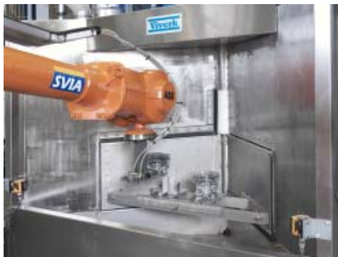
Robot laddar/lossar cylindrar.

Den är mycket servicevänlig och har inga spoldysor som behöver rengöras.